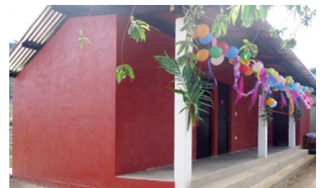
Interior y exterior de la vivienda.